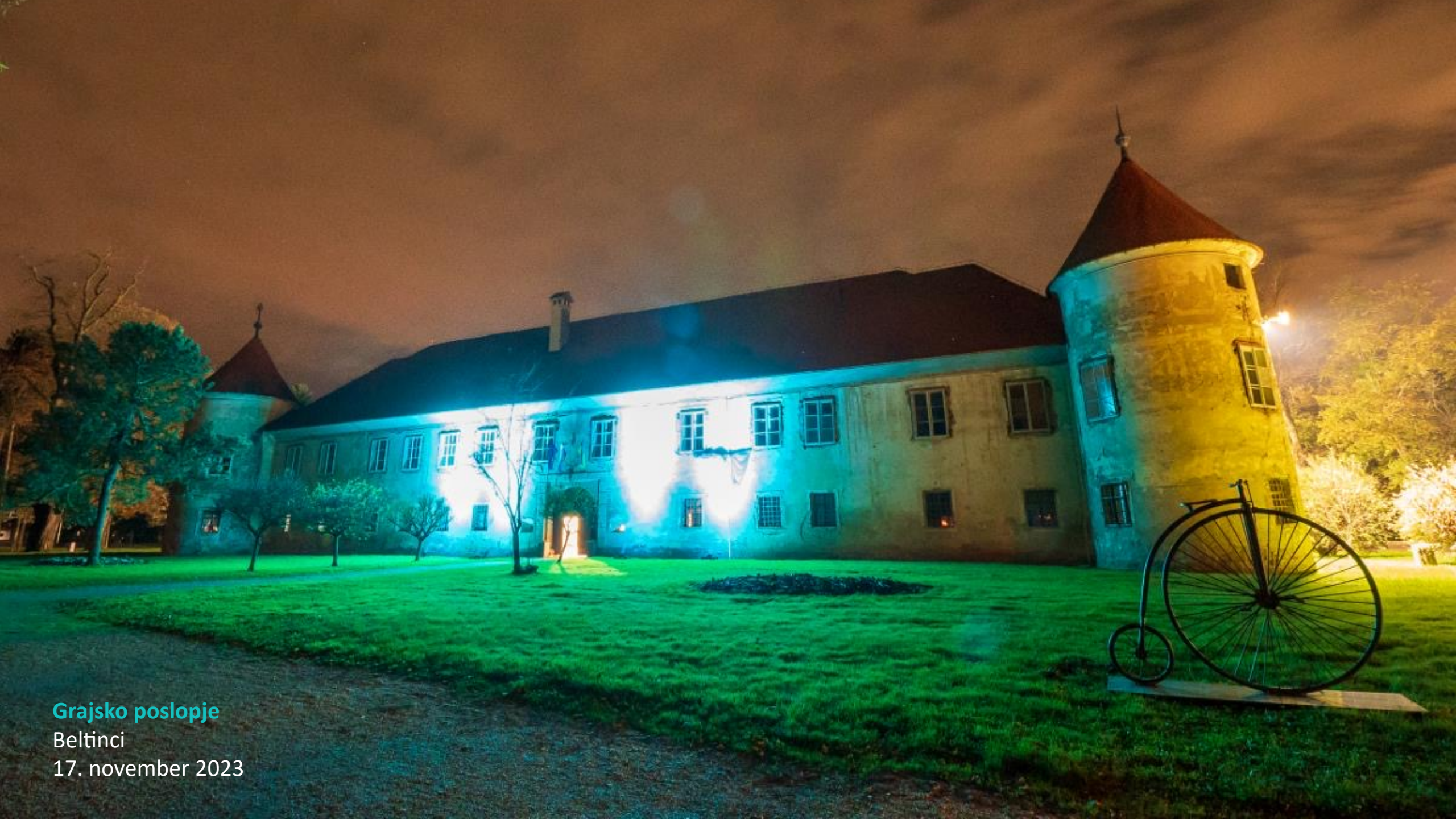
Grajsko poslopje Beltinci 17. november 2023