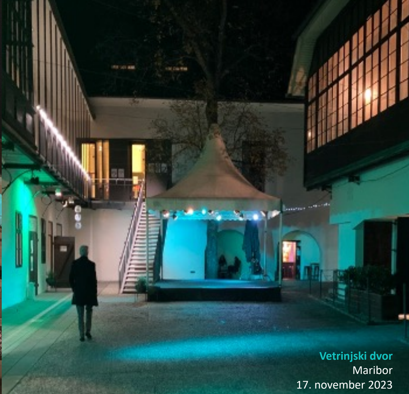
Vetrinjski dvor Maribor 17. november 2023