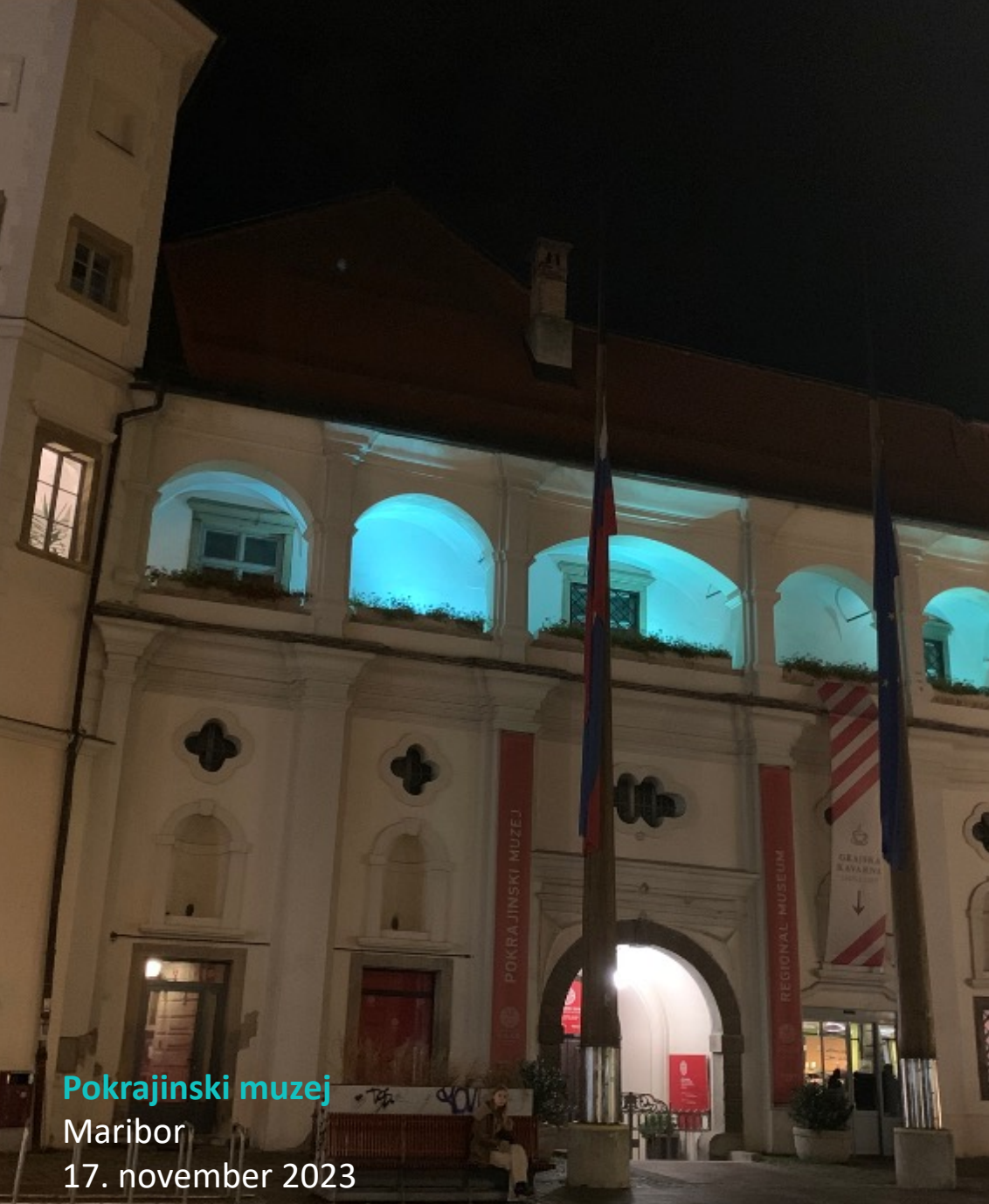
Pokrajinski muzej Maribor 17. november 2023